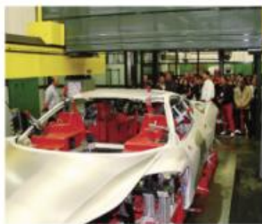
Una fase di produzione delle scocche in Fontana

Nel corso di quest'anno la Fontana ha da prima acquistato l'ex Prima Sala, dove già era insediata ma soltanto in affitto e poi ha rilevato gli immobili della ex Erc, un'area da 50mila metri quadri di cui 20mila coperti in via Sassi, sempre a Calolzio. L'ex Erc, azienda che era specializzata nella produzione di componenti elettrici, è fallita nel 2014 e da allora l'area, adiacente al cantiere dell'imbocco calolziense della nuova